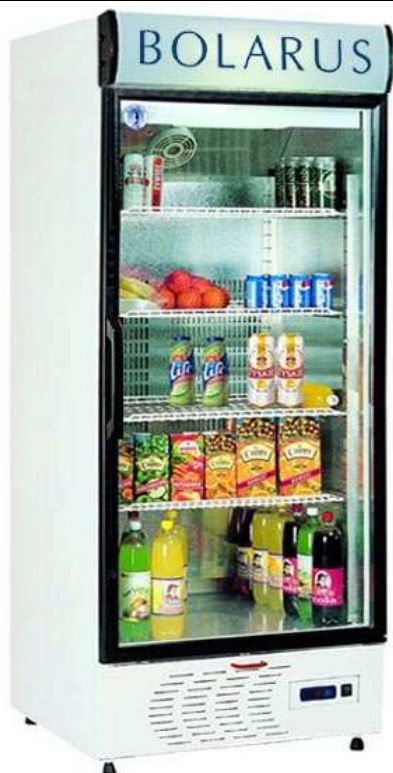
WS- 712 D